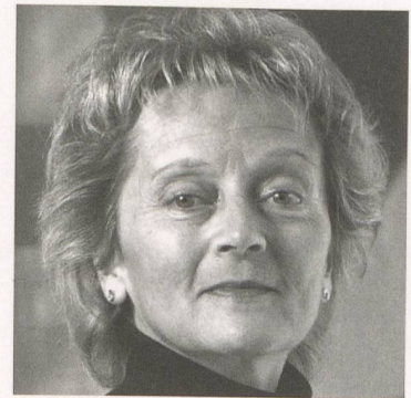
Hauptreferentin Eveline Widmer-Schlumpf

Bundesrätin, Vorsteherin des eidg. Finanzdepartements