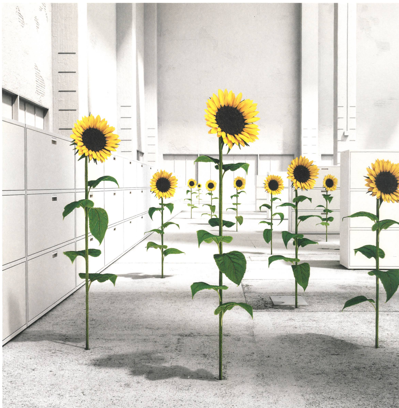
Stauraumsystem LO QUB

Lista Office LO in Ihrer Nähe > www.lista-office.com/vertrieb