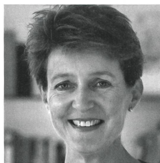
Simonetta Sommaruga Bundesrätin, Vorsteherin des Eidg. Justiz- und Polizeidepartements EJPD

Dienstag, 24. April 2012 09.00 bis 18.00 Uhr