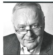
Gottlieb F. Höpli war bis ins Jahr 2009 Chefredaktor des «St. Galler Tagblatts» und ist Präsident des Vereins Medienkritik Schweiz.