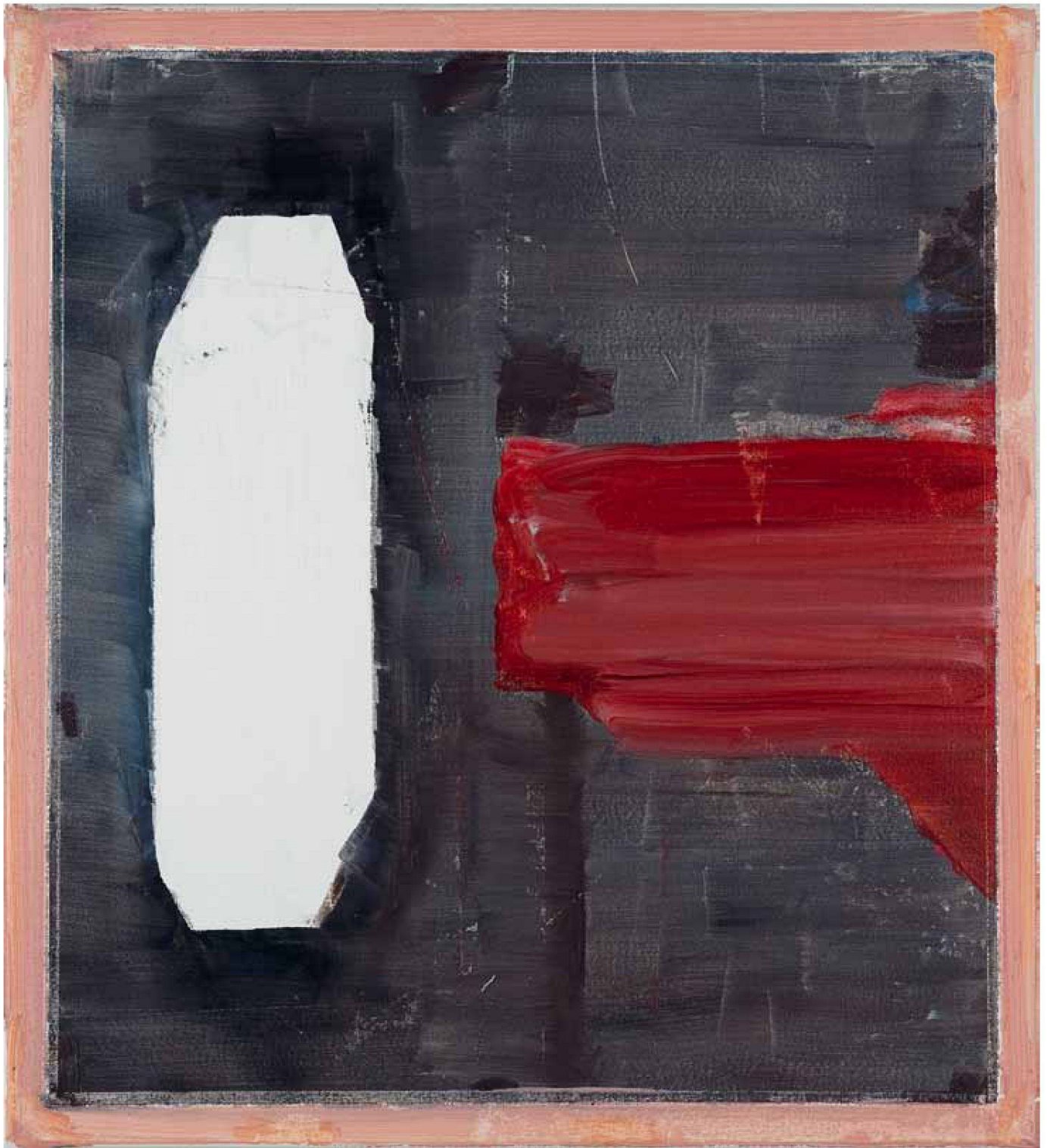
«Matteo», 2009, Öl auf Leinwand, 50 x 45 cm