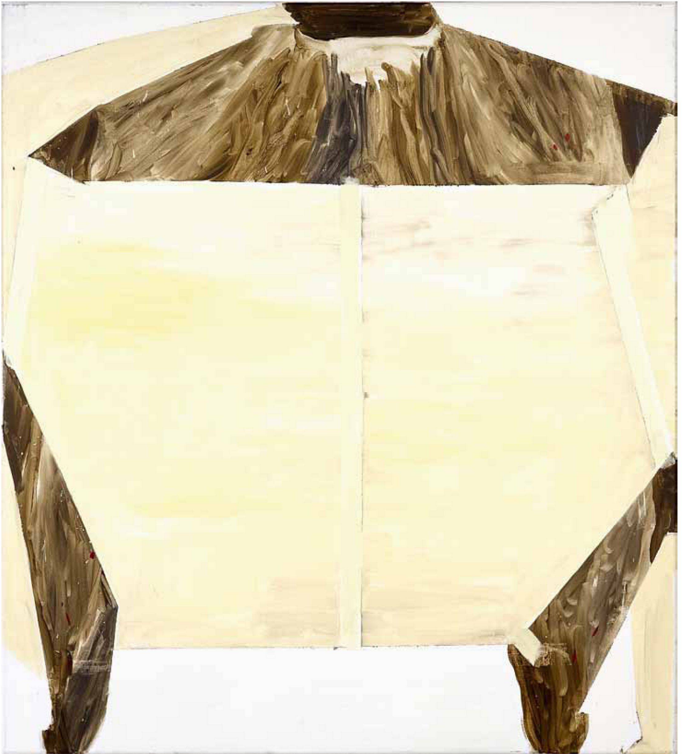
«Das helle Feld», 2003, Öl auf Leinwand, 130 x 117 cm