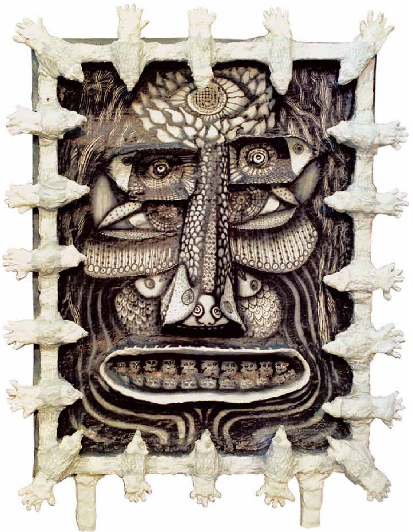
«Maske», Objekt, Mischtechnik, 110 x 140 cm, 1974