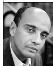
Kwame Anthony Appiah, geboren in London und aufgewachsen in Ghana, bekleidet heute nach Professuren in Yale, Cornell, Duke und Harvard einen Lehrstuhl für Philosophie in Princeton.