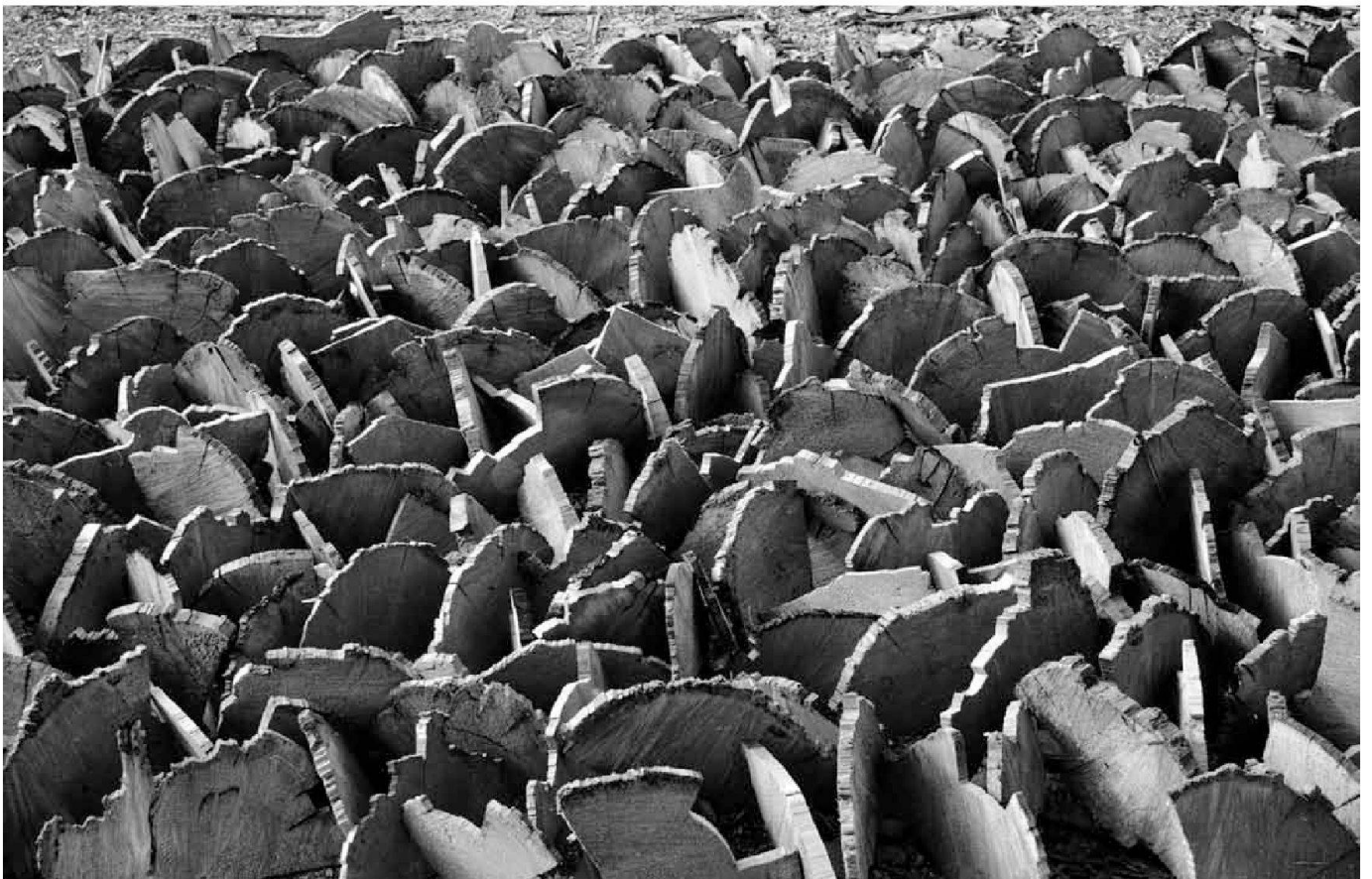
«Douglas-Fir-Carpet», Golden (BC, Kanada), 2000