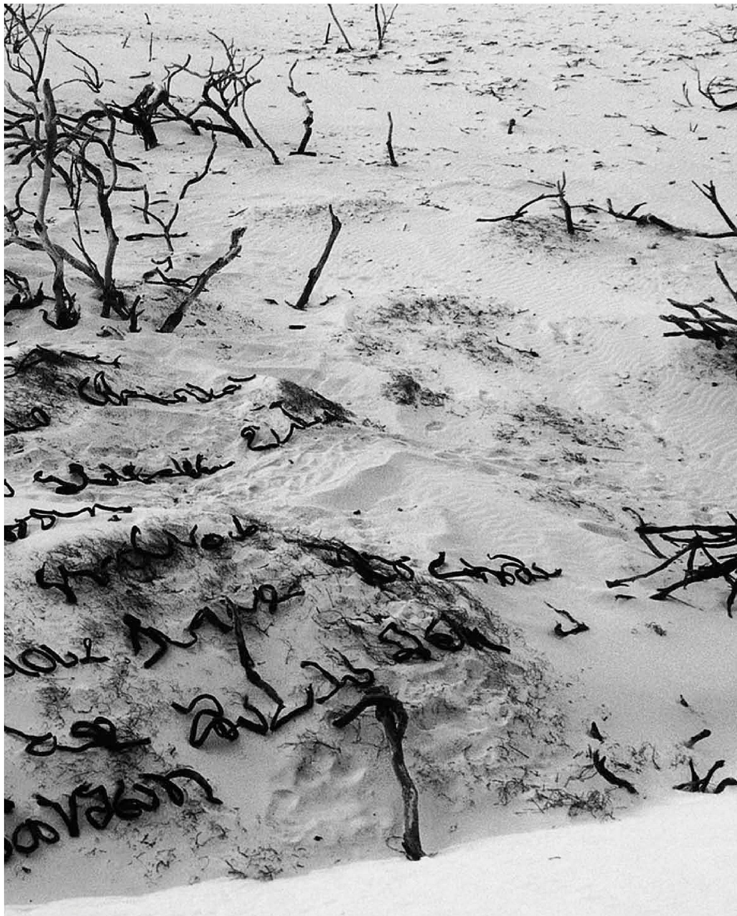
«Postcard», Cape of Good Hope, Sea Bamboo, 2000