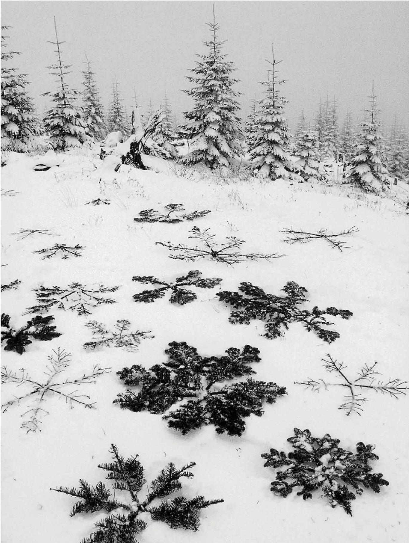
«Noble Fir Crystals», Mt. St. Helens (WA, USA), 2000