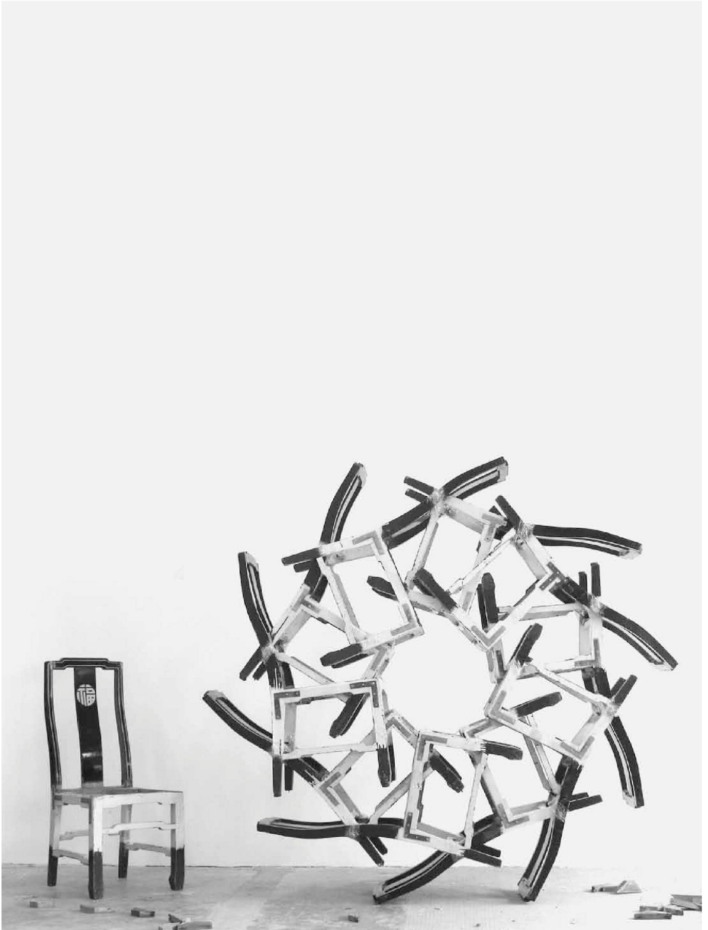
«Eleven Chairs», 789 Project Space, Beijing, 2006