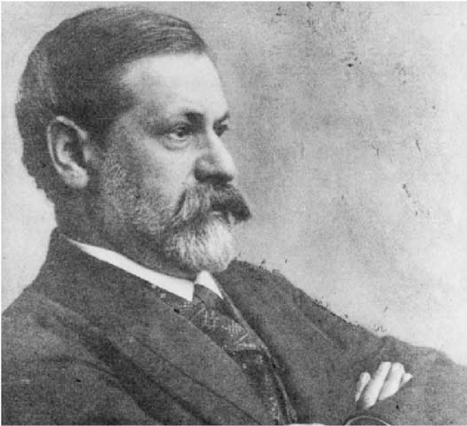
Sigmund Freud (1856–1939)