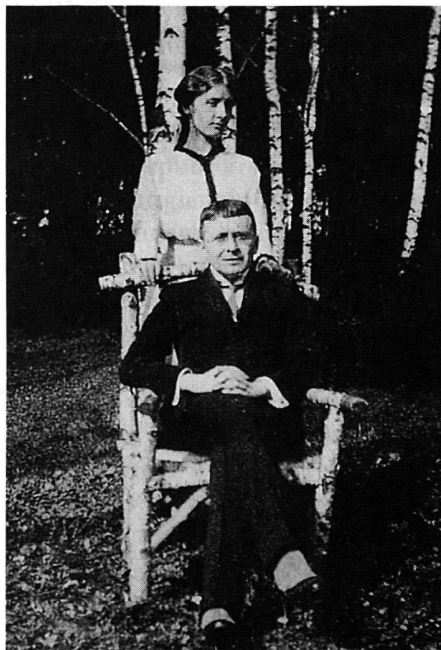
Sidonie Nádherny und Karl Kraus auf der Wiese im Park des Schlosses Janowitz, Sommer 1915.