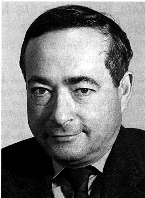
George Steiner.

Soweit so einleuchtend, so informativ, so anregend. Messen wir Steiners Versuche jedoch an dem, was er nicht müde wird zu kritisieren, der Verfremdung der Kultur durch die Flut des Sekundären, dann können wir schwerlich umhin, den «Garten