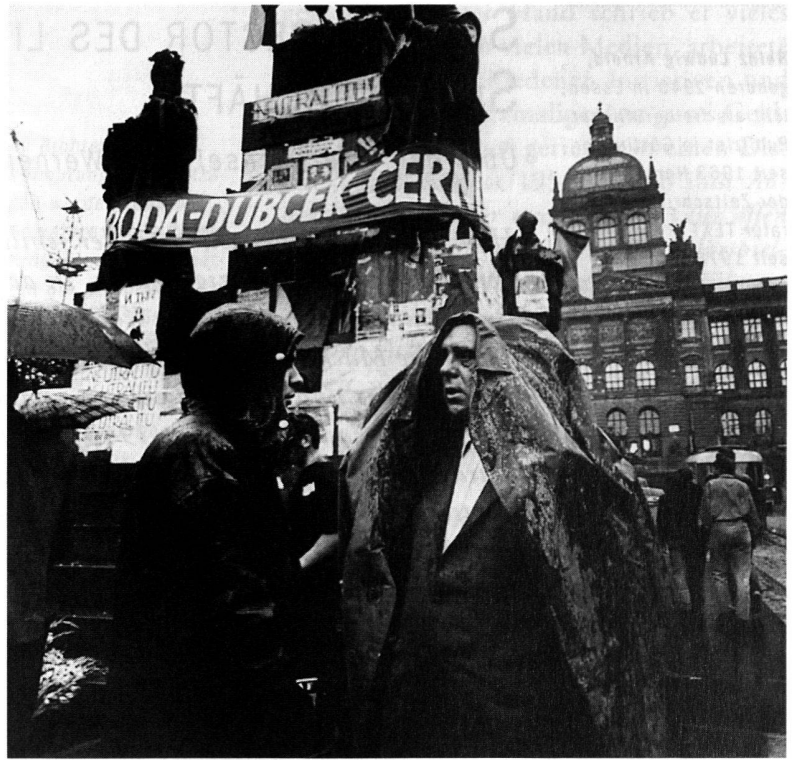
Betroffen am Prager Wenzelsplatz nach dem sowjetischen Einmarsch: Heinrich Böll.

Einige Literaten reden von 1969 an freilich schon vom «Schiffbruch» – eine Metapher,