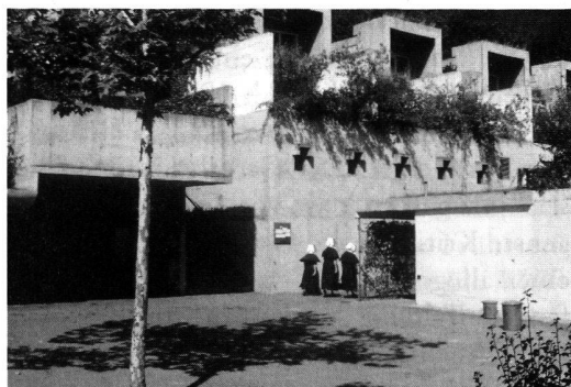
Siedlung Halen, Stuckishaus bei Bern, 1954–1961. Architekt: Atelier 5, Bern.

Als kompakte, gegen die Zersiedelung der Landschaft gerichtete Bebauung ist die Siedlung Halen des Ateliers 5 in Stuckishaus konzipiert, die Anfang der sechziger Jahre international Aufsehen erregte.