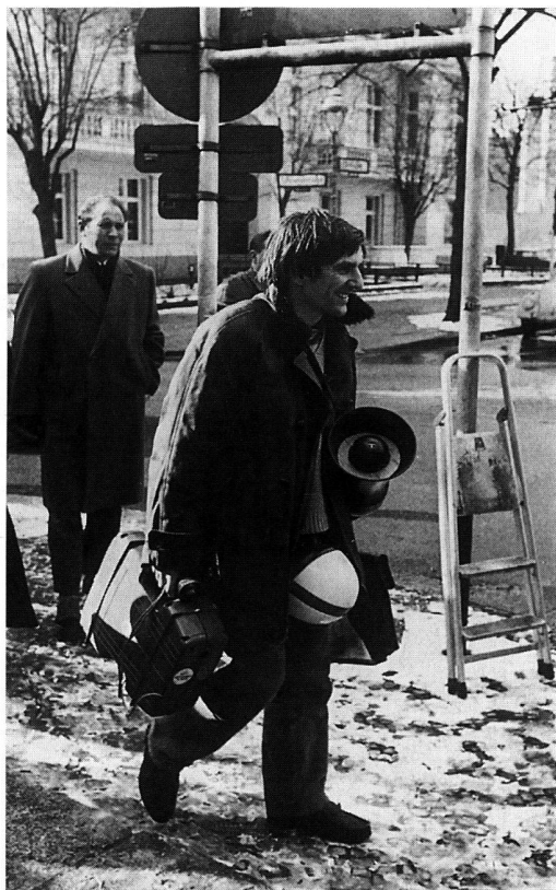
Heiter auf dem Weg zur Demo, die notwendigen Utensilien in der Hand: Rudi Dutschke.

Mögen die Studentenrevolten in der Bundesrepublik Deutschland eigene Voraussetzungen und Motive gehabt haben, die Bewegung ist weltweit. In Washington demonstrieren am 21. Oktober 1967 über 250 000 Menschen gegen den Vietnamkrieg. Eine Woche später gehen in Madrid 20 000 Menschen für Freiheit und Demokratie auf die Strasse. Das Ende des Franco -Regimes kündigt sich an. Am 5. April 1968 wird Martin Luther King ermordet. In Paris und Prag allerdings nehmen die Revolten den Charakter der Revolutionären an. In Paris, weil sich Studenten und Arbeiterschaft miteinander verbünden – die Folge ist ein Generalstreik, in Prag, weil Alexander Dubčeks Sozialismus einer mit menschlichem Antlitz zu werden verspricht.