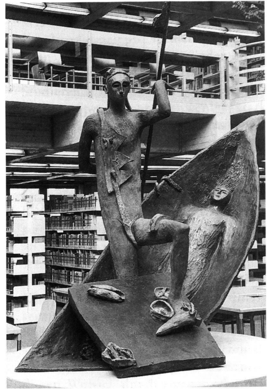
Mimmo Paladino, Giardino chiuso, 1993, Universität St. Gallen.