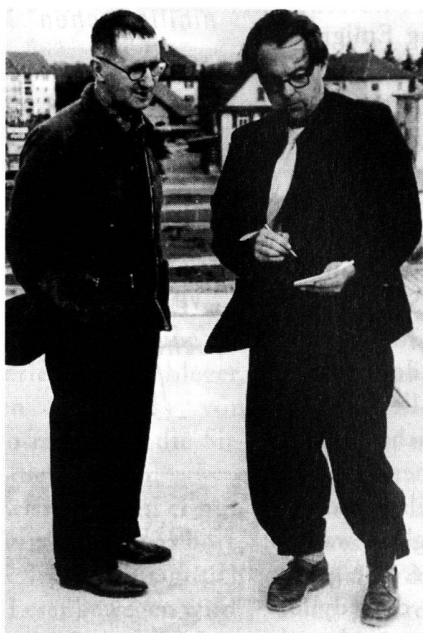
Bertolt Brecht und Max Frisch 1947 in Zürich.

Liest man Brechts Gedichte im Zusammenhang, dann gerät man unwillkürlich ins Sprechen und trägt sich selbst eines ums andere vor; denn sie verführen zur Rezitation, sind geschrieben, um uns aufhören zu lassen. Zwar merkt man noch den späten Gedichten die Patenschaft Villons und Rimbauds an, insbesondere aber jene Schillers. Das Poetische Brechts verdankt sich wesentlich einer Verbindung aus