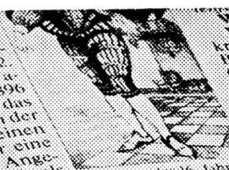
Wams des 16. Jahrh

Wander (Wanderer) Waa, Stadt in Wan Wanamaker [wɔːnəmeɪkəl] mann dt. Abstammung. * Ph Philadelphia 11.7.1838. † das. 12. 12.1922; gründete 1861 ein Wa renhaus in Philadelphia, 1896 ein zweites in New York, das sich zu einem der größten der Welt entwickelte. In seinen Unternehmen führte er eine Kunstfreund bekannt.