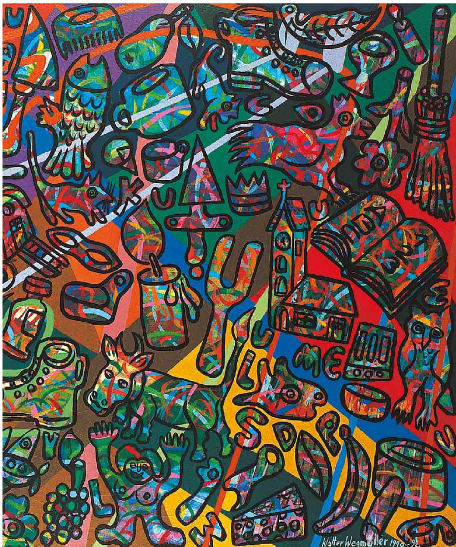
«Die Schaukel», Mischtechnik auf Leinwand, 300 x 150 cm, 1992