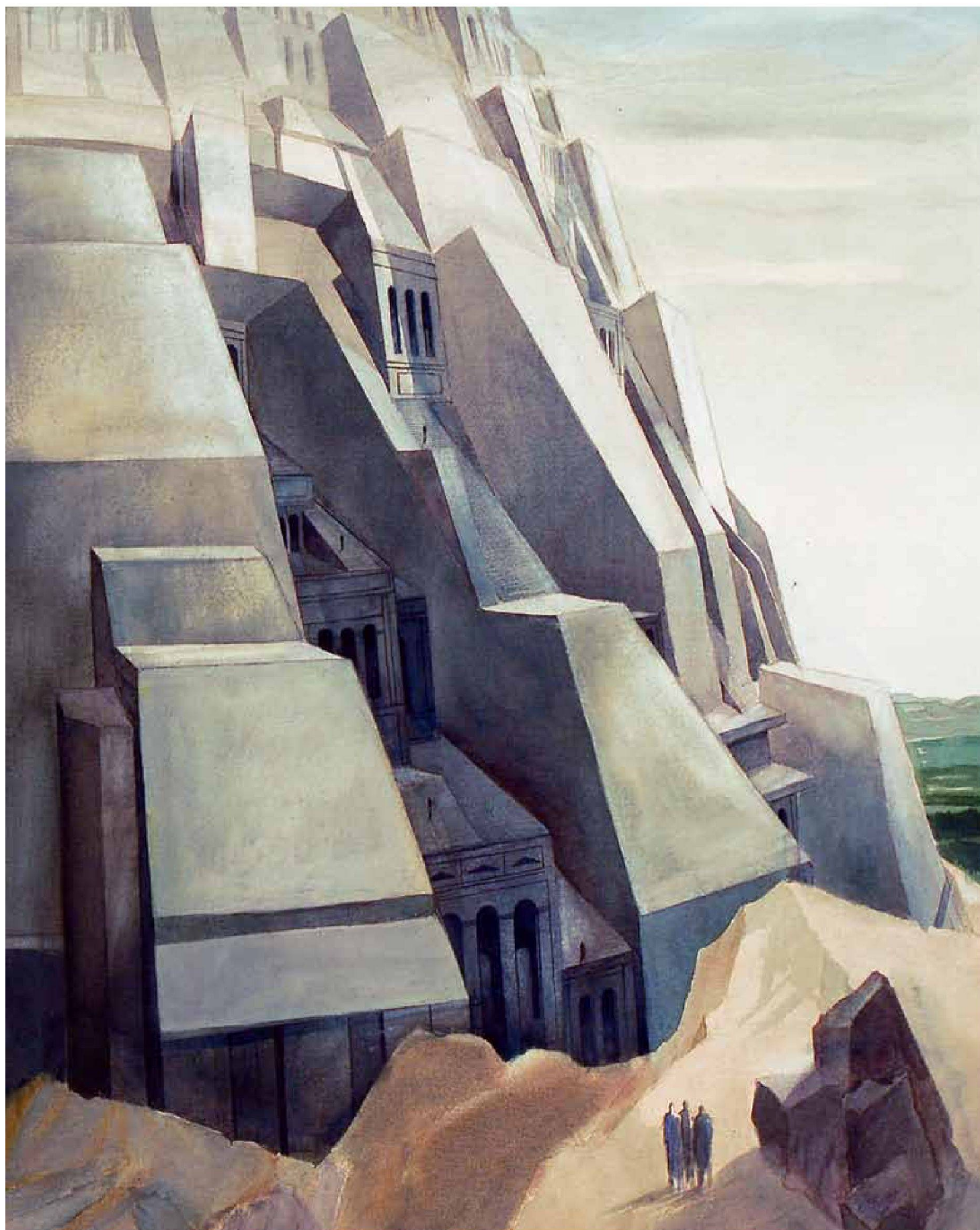
«Grosses Bollwerk», Aquarell, 140 x 94 cm, 2003