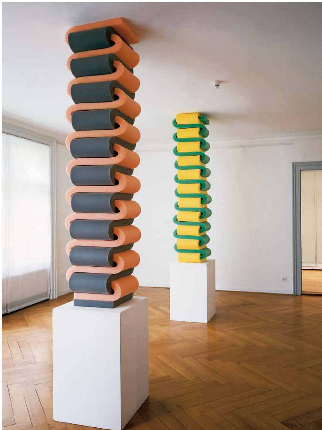
«Schnelle Säule No. 1 und No. 2», 5-cm- Schaumgummistreifen geflochten, Museum Bellpark Kriens, 1997