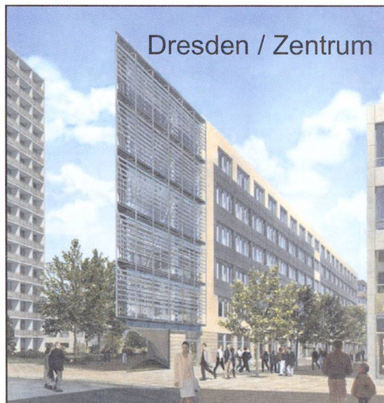
Dresden / Zentrum

Tel: +49 (0)30 / 20 24 96 - 0 Fax: +49 (0)30 / 20 24 96 - 51 Email: info@dbmholding.de www.dbmholding.de