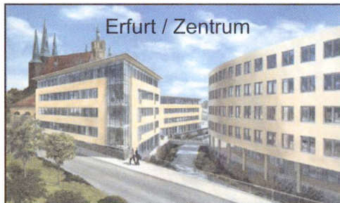
Erfurt / Zentrum

Aktuell vermieten wir Restflächen in unseren folgenden Objekten: