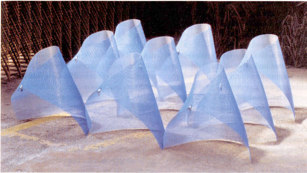
Lucie Schenker, «Die Blauen», 200 x 200 x 60 cm, Metallgewebe verzinkt, einseitig gespritzt, Klammern.