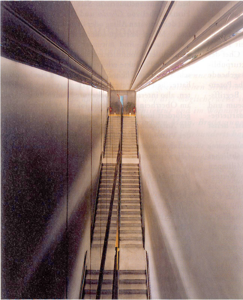
Silvia Gmür und Livia Vacchini: Ladenumbau Papyrus, 1997–1999.

und dem Bauherrn herstellte. Für andere Paarungen wird dies mit grosser Wahrscheinlichkeit ebenfalls zutreffen.