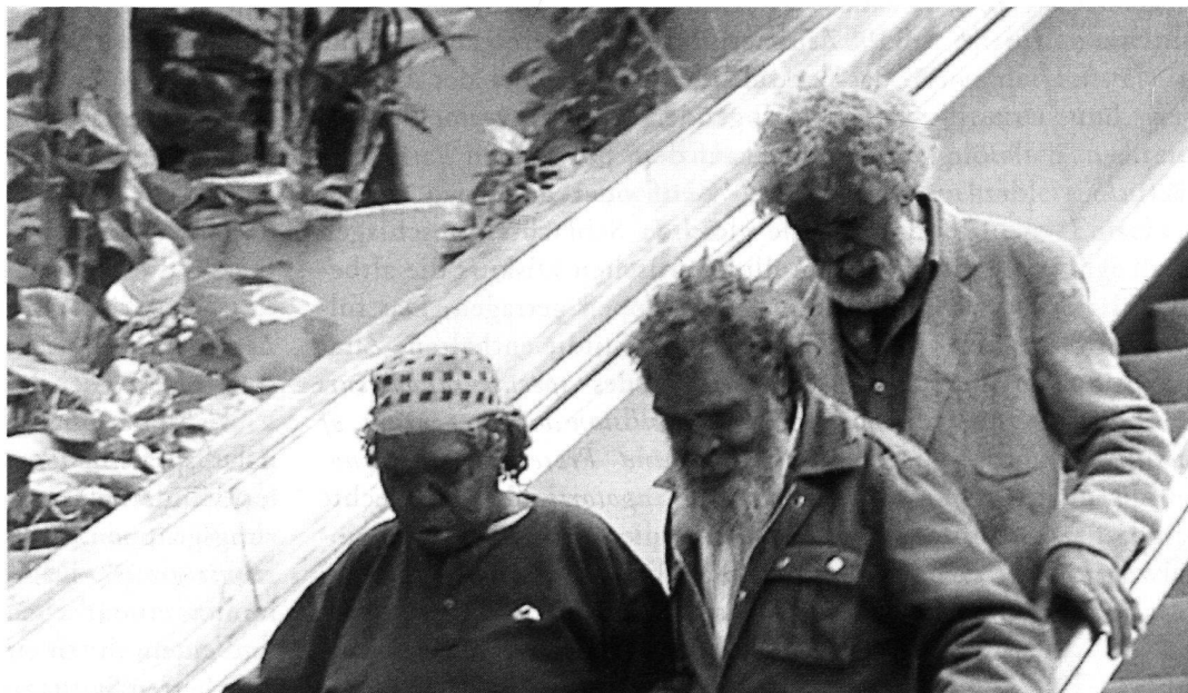
Australische Aborigines im Supermarkt, aus: Hans Küng, Spurensuche. Die Weltreligionen auf dem Weg . Piper München 1999.

Die einzig freie Entscheidung eines Mitglieds einer ethnischen Gemeinschaft ist der Austritt aus oder der Wiedereintritt in den eingeborenen Verband, sowie der Beitritt zu einer dort oder anderswo begründeten religiösen Gemeinde. Jeder Mensch wird frei und mit seiner individuellen Würde geboren, jedoch ohne Religion. Die Verquickung religiöser Minderheiten mit den oben genannten ist sicher mit ein gewichtiger Grund für das Durcheinander bei der nicht zu leugnenden Tatsache, dass sprachliche, nationale, regionale, autochthone, indigene oder eben kulturelle Minderheiten in Wahrheit Völker, Volksgruppen oder (als kleinste Einheit) Stämme sind. Das Schicksal der Basken demonstriert, wie durch eine einst willkürlich gezogene Grenze zweier Nationalstaaten aus einer Volksgruppe zwei (ethnische) Minderheiten werden. Und Exempel demonstrieren dann ebenso, warum die EU z.B. auf dem Balkan nicht zu einer Frieden stiftenden Lösung finden kann. Und auch die Uno versagt da kläglich, obwohl sie doch angeblich global «im