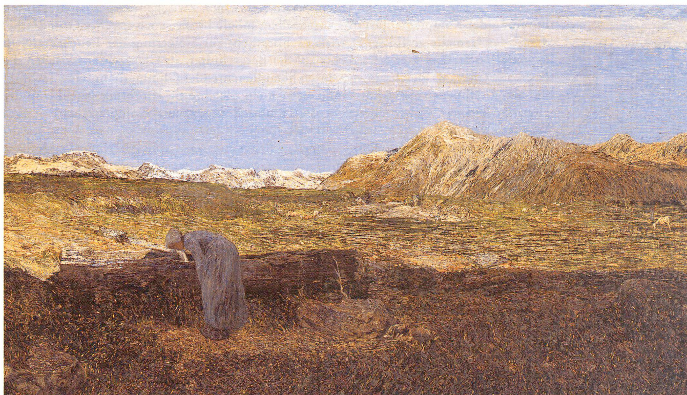
Giovanni Segantini, Alpenlandschaft mit Frau am Brunnen (um 1893). Öl/Leinwand, 71,5 x 121,5 cm. Museum Oskar Reinhart, Winterthur.