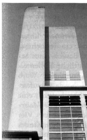
Maschinenlaboratorium mit Fernheizwerk der ETH Zürich (1930–1935). Architekt: Otto Rudolf Salvisberg

Als Otto Rudolf Salvisberg 1928 seine Berufung als Professor und Nachfolger von Karl Moser an der Architekturabteilung der ETH Zürich annahm, war ihm versprochen worden, vom Bund Bauaufträge zu erhalten. Er begann wenige Wochen nach Beginn seiner Lehrtätigkeit mit der Arbeit am Komplex des Maschinenlaboratoriums und des Fernheizwerks.