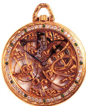
Goldene Prunk-Skelettluhr, 18 Karat Royama, Val de Joux um 1980