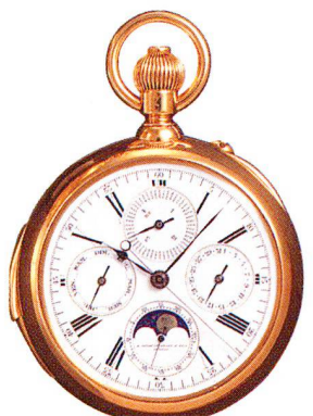
Golduhr, 18 Karat, mit ewigem Kalender A. Golay & Leriche & Fils, Genève um 1900