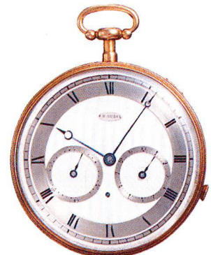
Golduhr, 18 Karat, mit Viertelrepetition und Wecker, Charles Oudin, Paris um 1810