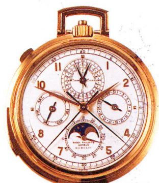
Golduhr, 18 Karat, "Grande Complication" Patek Philippe, Genève um 1931