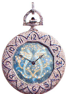
Platin-Anhängeuhr, mit Brillanten besetzt Longines, St-Imier um 1922