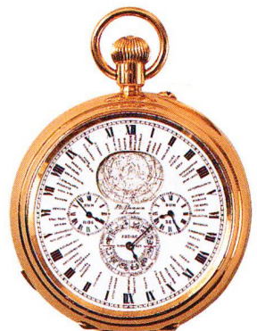
2-seitige astronomische Golduhr, 18 Karat J. W. Benson, London um 1870