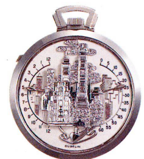
Platinuhr mit Figurenzeiger "Bras en L'Air" Vacheron & Constantin, Genève um 1955