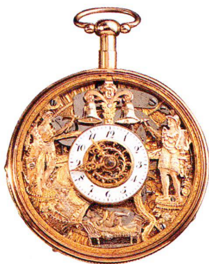
Golduhr, 18 Karat, mit erotischem Figurenautomaten, Westschweiz um 1830