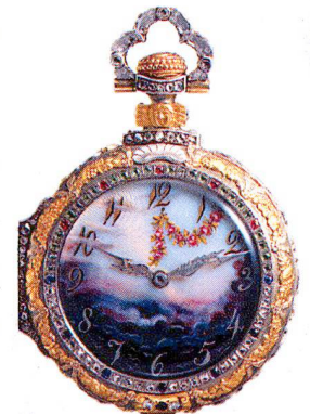
Jugendstiluhr mit Edelsteinen verziert Paris 1904