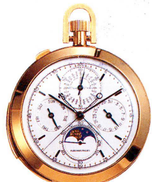
Golduhr, 18 Karat, "Grande Complication" Audemars Piguet, Genève um 1920