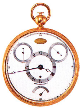
Gold-Tourbillon "Garde Temps" Abraham Louis Breguet, Paris um 1806