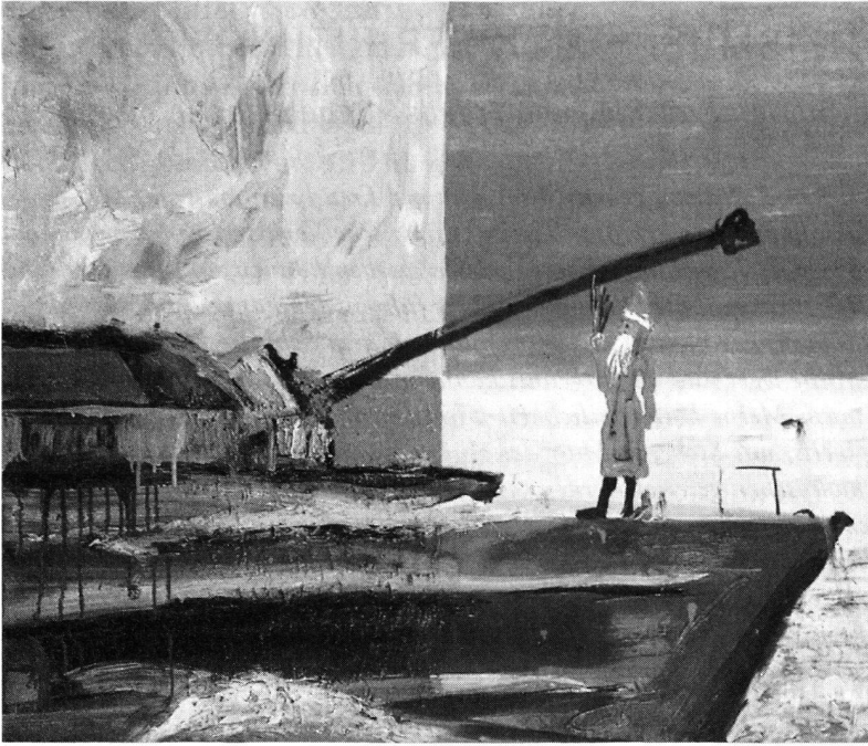
Martin Kippenberger, «Krieg böse» 1983, Öl, 100 x 120.