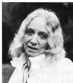
Erika Burkart

Wäre mir heute ein Gespräch mit Max Rychner vergönnt, wünschte ich, mich mit ihm über den ihm wahlverwandten gnomischen Denker Lichtenberg zu unterhalten, den er, der liebende Leser, mit einem unvergesslichen Gedenkwort geehrt hat im Manesse-Band «Aphorismen» von Georg Christoph Lichtenberg. Herausgegeben von Max Rychner. ♦