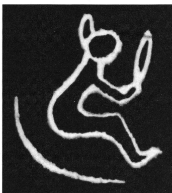
Indianisches Zeichen: Der Mann, der Macht besitzt.

Aufgrund des «Removal-Act» von 1830 wurde die Deportation aller überlebenden Indianerstämme im Osten der USA nach Oklahoma befohlen. Bis 1839