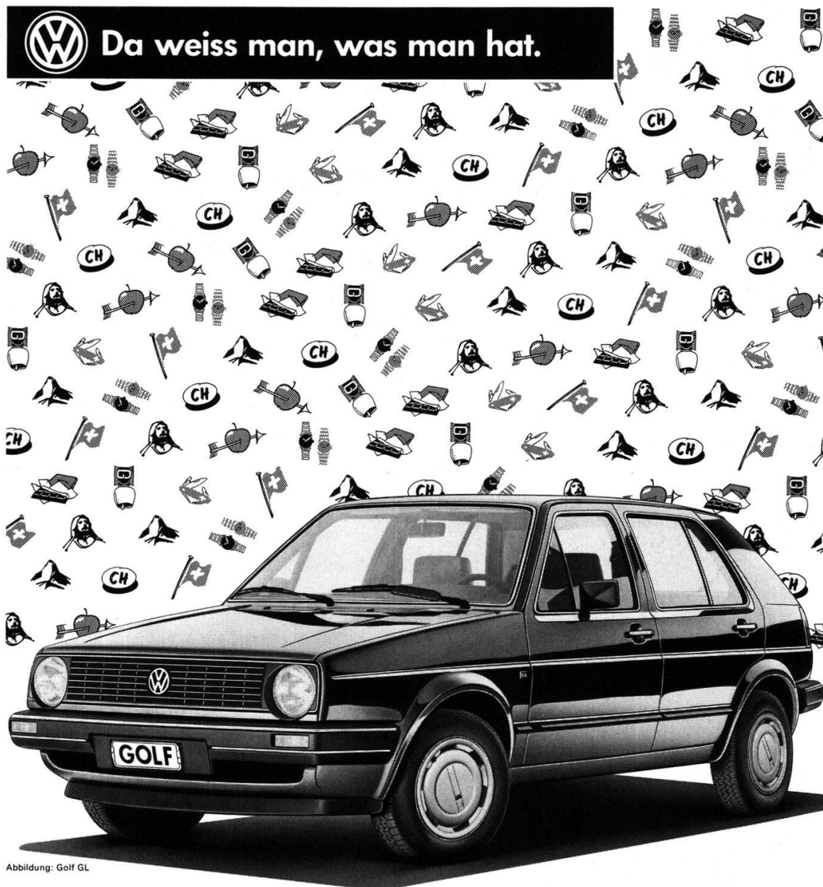
Abbildung: Golf GL