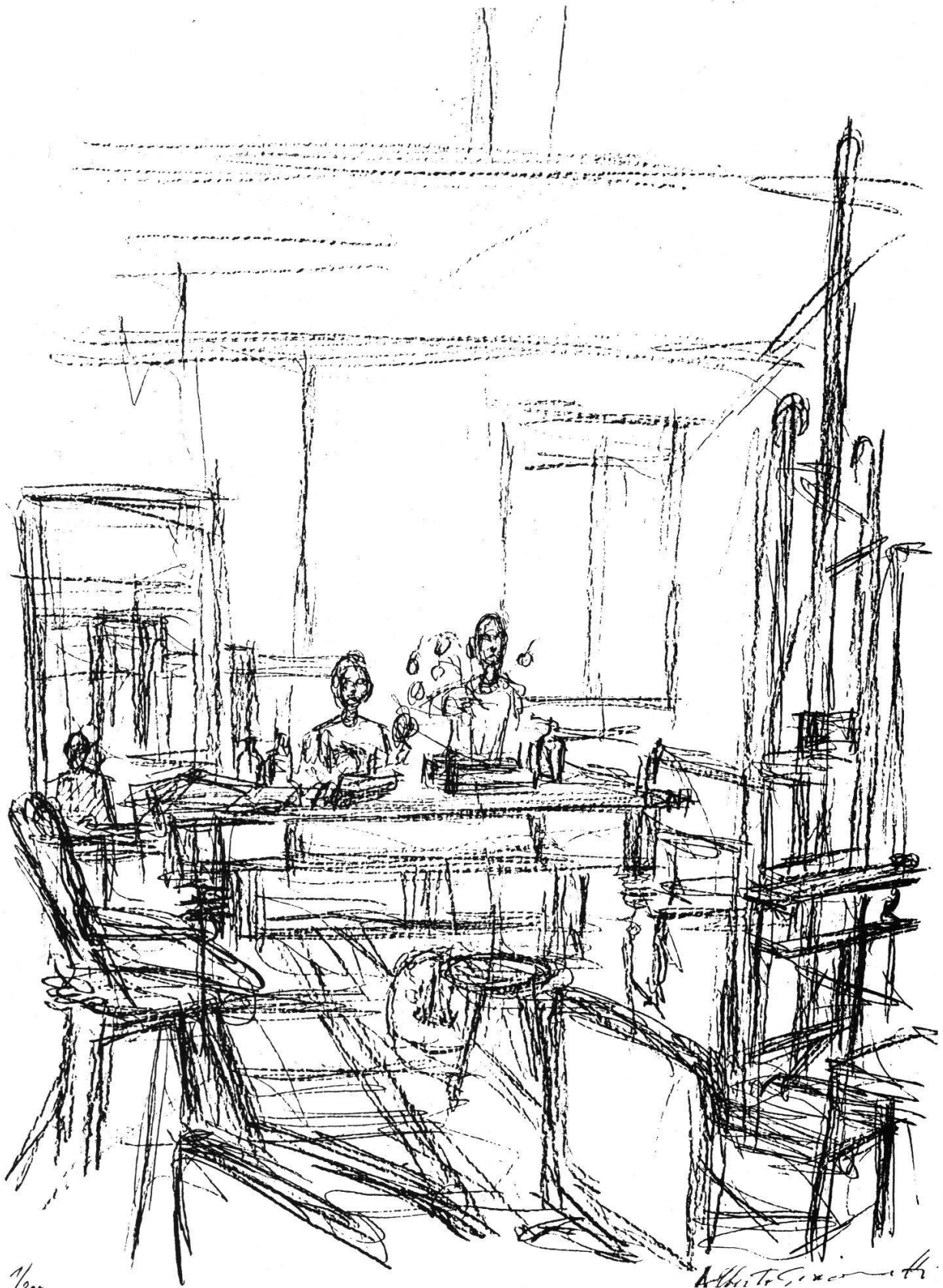
ATELIER, 1965 LITHOGRAPHIE VON ALBERTO GIACOMETTI (1901–1966)