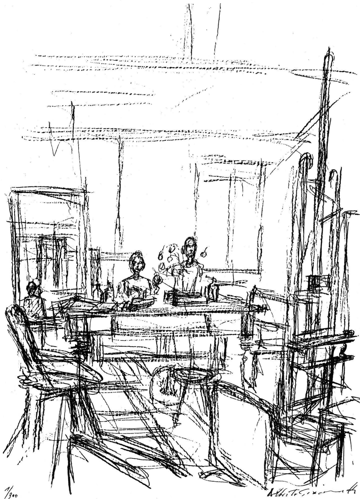
ATELIER, 1965 LITHOGRAPHIE VON ALBERTO GIACOMETTI (1901–1966)