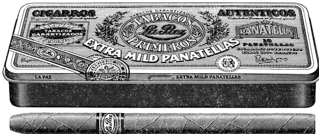
Extra Mild Panatellas von La Paz in 10er-Blechdosen Fr. 9.-. Nur im guten Fachhandel.

Es ist schon ein besonderes Vergnügen, kostbare Cigarren von vollendeter Form zu geniessen. Denn nichts geht über die Freuden von Auge und Gaumen.