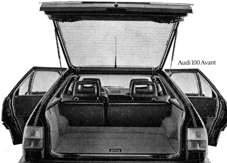
Audi 100 Avant

Audi 100 und Audi 100 Avant auch als quattro mit permanentem Allrad-Antrieb.