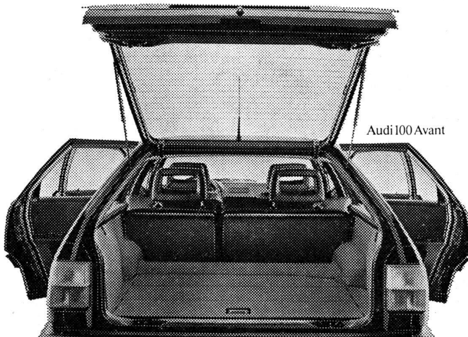
Audi 100 Avant

Audi 100 und Audi 100 Avant auch als quattro mit permanentem Allrad-Antrieb.