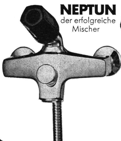
NEPTUN der erfolgreiche Mischer