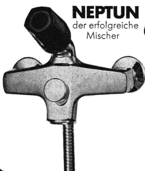
NEPTUN der erfolgreiche Mischer