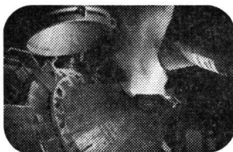
Im neuen AOD-Konverter entsteht hochlegierter Qualitätsstahl

der Verfahrensentwicklung sind nicht nur Qualität und Wirtschaftlichkeit der Methoden, sondern auch Sicherheit der Mitarbeiter und Schutz der Umwelt.