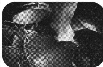
Im neuen AOD-Konverter entsteht hochlegierter Qualitätsstahl

Im Zeitstandlabor zum Beispiel hatte man in langwierigen Versuchen die Eigenschaften des Stahlgusses bei erhöhten Temperaturen ermittelt. Dank dieser Pionierleistung wurde auf dem Gebiet der Stahlleistung eine führende Stellung erobert. Gelingt es, mit kleinem zusätzlichem Aufwand die Eigenschaften eines bestimmten Produktes zu verbessern oder die Herstellungskosten zu senken, ist damit ein technischer Fortschritt erzielt.