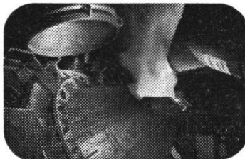
Im neuen AOD-Konverter entsteht hochlegierter Qualitätsstahl

gussstücke für Turbinen eine führende Stellung erobert. Gelingt es, mit kleinem zusätzlichem Aufwand die Eigenschaften eines bestimmten Produktes zu verbessern oder die Herstellungskosten zu senken, ist damit ein technischer Fortschritt erzielt.