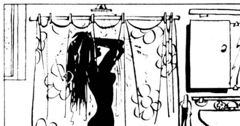
Dusche = 70% Energie-Einsparung