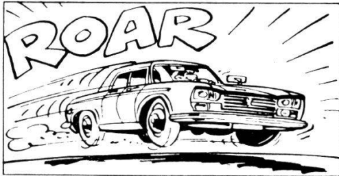
130 km/h = grosser Benzinverbrauch