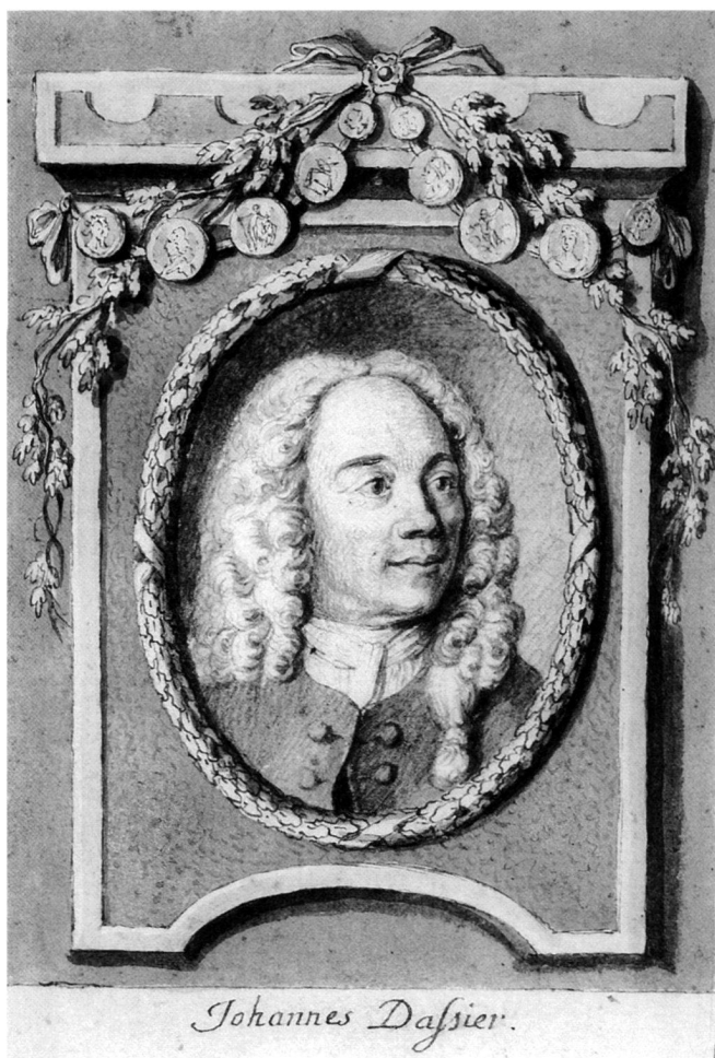
Figure 1: J.-E. Liotard (attributed), Jean Dassier , undated (ca. 1726?), pastel on paper, 55 x 44 cm. Cabinet des dessins, Musée d'art et d'histoire, Geneva, inv. D 1998-502.

In 1998, the Cabinet des dessins of the Musée d'art et d'histoire acquired an impressive portrait in pastels of the celebrated Genevan medallist Jean Dassier at public auction (fig. 1) 1 . The picture is currently on view in the exhibition 'Jean Dassier (1676–1763): médailleur genevois et européen. Genève, Paris, Londres 1700–1733' (Musée d'art et d'histoire, Geneva, until 3 February 2002) 2 . On the occasion of the first exhibition ever devoted to the engraver, the author wishes to offer this brief note on the history of the portrait.