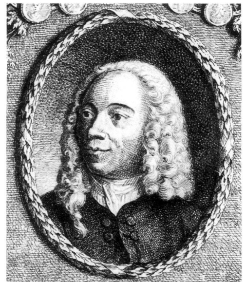
Figure 3: J.R. Schellenberg (1740–1806), Jean Dassier , 1771, engraving in J.K. Füssli, Geschichte der besten Künstler in der Schweiz , vol. IV, Zurich 1774, p. 93.