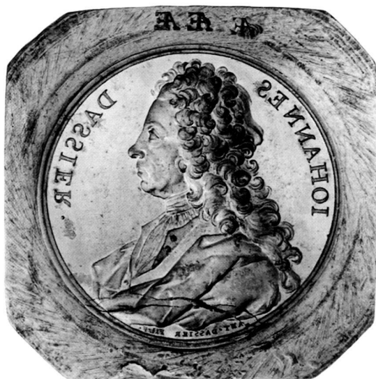
Figure 4: Antoine Dassier (1718–1780), Jean Dassier, undated (1771?), die for the obverse of a medal, steel, 2087 g, Ø 54.3 mm, Cabinet de numismatique, Musée d'art et d'histoire, Geneva, inv. CdN 1999-104.

Haller's copy of the original mémoire is preserved in his correspondence 6 , together with the letter cited above 7 . A comparison between the Dassier brothers' manuscript, in French, and Füssli's German text reveals that the latter is a word-for-word translation of the former. Haller likewise published the Dassiers' text, in a slightly abridged form and in French, under his initial «H.» in the Encyclopédie d'Yverdon of Barthelemy De Félice 8 .