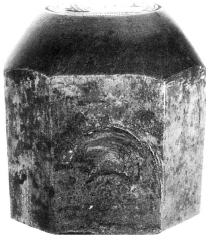
Rückseitenstempel zum Sechzehnerpfennig 1737 (zu Kapossy 2)