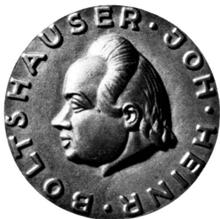
Jubiläumsmedaille J. H. Boltshauser

Auskünfte über die Talerausgabe sowie Talerbestellungen können an das Finanzkomitee der Internationalen Rheinschiffahrtstage 1954, c. o. Bankhaus A. Sarasin & Co., Freiestraße 107, gerichtet werden.