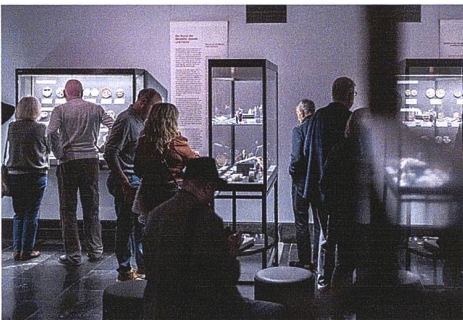
Ausstellung in den Antikensammlungen München / Exposition

Höhepunkt der Veranstaltung war die internationale Medaillenausstellung, ein unverzichtbarer Bestandteil jeder FIDEM, die einen Überblick über die aktuellen Werke aus 30 Ländern bot. Sie ist noch bis zum 26. Januar 2026 in der Antikensammlung München zu sehen.