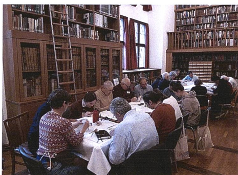
Les artistes pendant le workshop / Die Künstler und die Künstlerinnen während des Workshops

Du 15 au 18 octobre, le Kunstareal de Munich a vécu au rythme de la 38 e biennale de la FIDEM. Près de 150 artistes, chercheurs spécialistes de la médaille et personnes intéressées ont célébré la médaille contemporaine à l'occasion de cette manifestation organisée par la Staatliche Münzsammlung de Munich. Le thème de la manifestation était « Nos mythes, nos origines ».