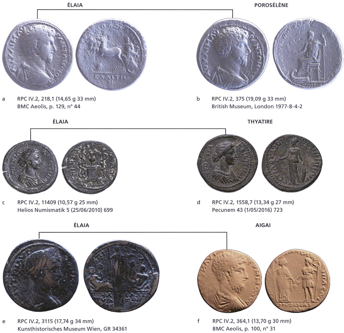
Fig. 2: Liaisons de coins de droit entre des monnaies d'Élaia, de Porosélène, de Thyatire et d'Aigai sous Marc Aurèle (a-b; Crispine : c-d) et Commode (e-f).