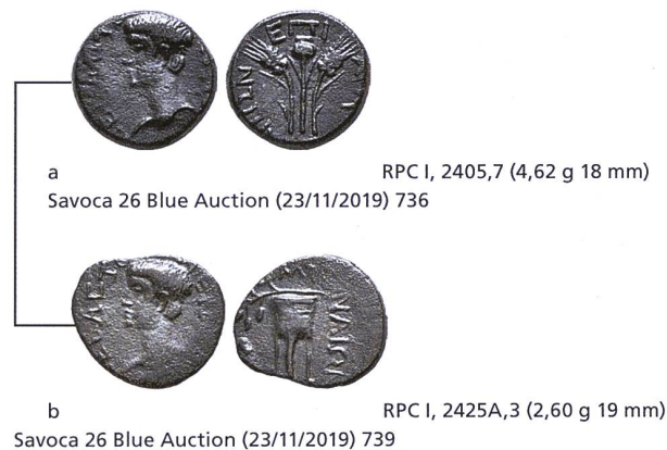
Fig. 1: Liaison de coin de droit entre un bronze d'Élaia (a) et un bronze de Myrina (b) du règne de Néron.

À Élaia, la première liaison de coin externe relevée dans le monnayage civique fut particulièrement précoce puisqu'elle remonte au règne de Néron, lorsque la cité partagea un coin de droit avec Myrina (Éolide, fig. 1 ). Outre l'ethnique de la cité, le bronze d'Élaia porte au revers le nom d'un certain Apphios 1 (ΕΠΙ ΑΠΦΙΟΥ) dont la fonction n'est pas précisée, tandis que celui de Myrina n'offre pour toute légende de revers que l'ethnique seul. Le-dit Apphios ayant signé des monnaies élaïtes au droit d'Agrippine, l'ensemble des bronzes qui le mentionnent peut être daté avec quelque certitude des années 54-59 p. C., en accord avec le portrait juvénile de Néron au droit. L'identification de ce coin commun à Élaia et Myrina constitue donc la plus ancienne liaison de coins (effective à la fin des années 50 p. C. probablement) relevée à ce jour dans l'ensemble du monnayage civique d'époque impériale. En effet, on ne connaissait jusqu'ici aucun cas de die sharing avant le principat de Trajan, sous lequel un même coin de droit fut utilisé par les cités ioniennes de Colophon et de Métropolis (Kraft n° 308) 2 .