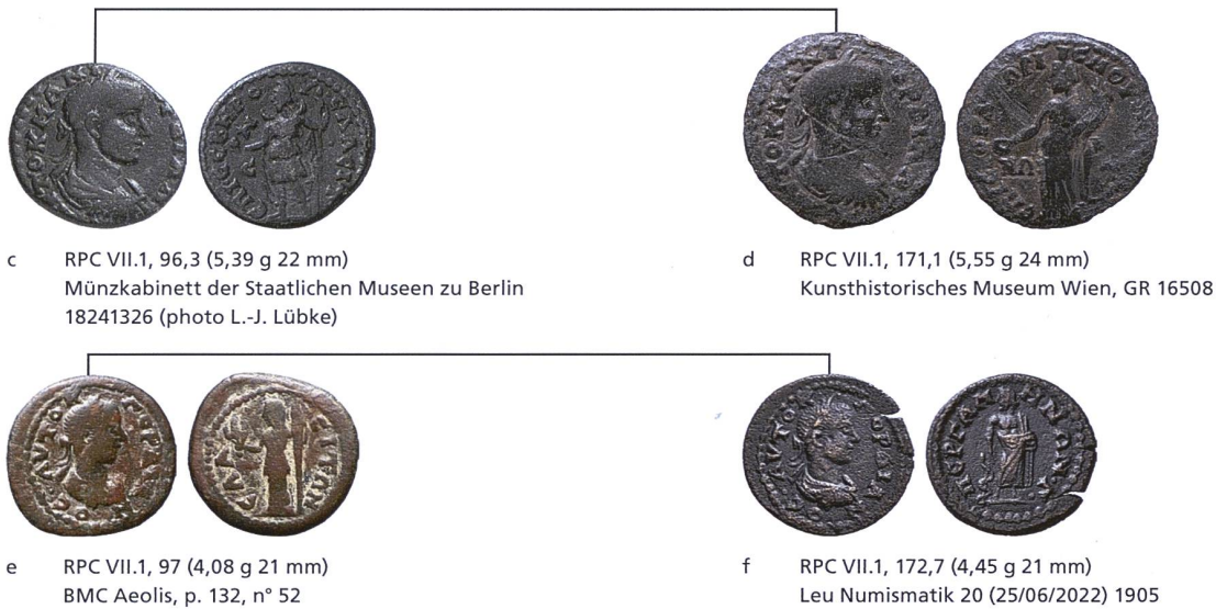
Fig. 3: Liaisons de coins de droit entre des monnaies d'Élaïa (a, c, e) et de Pergame (b, d, f) sous Gordien III.