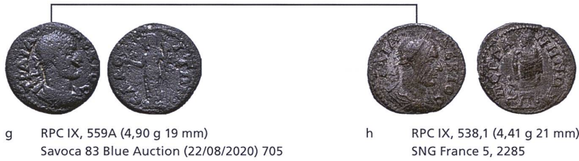
g RPC IX, 559A (4,90 g 19 mm) Savoca 83 Blue Auction (22/08/2020) 705