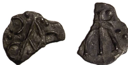
Fig. 2: denier inédit attribuable à Melle trouvé près du Château d'Hegi, fragment de 0,51 g, 13,9 mm, 9 h. Kantonsarchäologie Zürich, FmZH, LNr. 10017, échelle 2 : 1.

Parallèlement aux fouilles, les environs est et nord-est ont également été prospectés au détecteur de métaux. R. Baum, bénévole de l'Archéologie cantonale, y a trouvé, le 23 juin 2019, le denier mérovingien présenté ici (Fig. 2). En tant que découverte hors de la zone de fouille, la pièce n'a malheureusement pas de contexte archéologique plus précis et se trouvait dans l'humus récent, à quelques centimètres au-dessous de la surface.