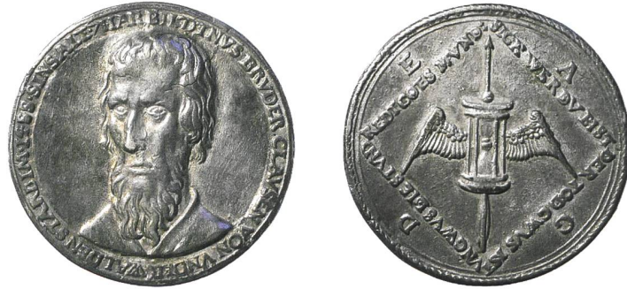
Abb. 3: Jakob Stampfer, Memorialmedaille auf Niklaus von Flüe, um 1550.

Unter Stampfers Arbeiten als Medailleur findet sich eine gegen Mitte des 16. Jahrhunderts datierbare Erinnerungsmedaille auf Niklaus von Flüe (1417–1487), Schweizer Bergbauer, Soldat, Einsiedler und Mystiker, Schutzpatron der Schweiz, kanonisiert 1947 (Abb. 3).