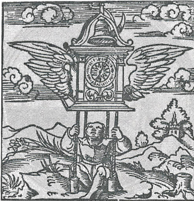
Abb. 4: Emblem «Die Zeit nutzen», Guillaume de La Perrière, Le théâtre des bons engins ,..., Paris 1539 (55 × 53 mm).