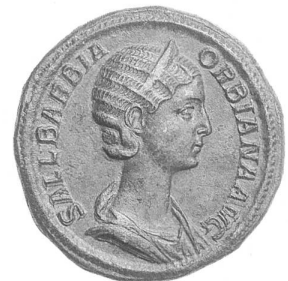
Sallustia Barbia Orbiana, sesterce de bronze