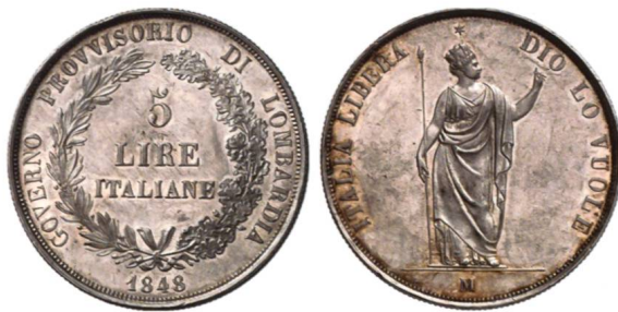
Abb. 1: Provisorische Regierung der Lombardei. 5 Lire 1848 M (Mailand). Geprägt während des Aufstandes. Dav. 206; Pagani 213.