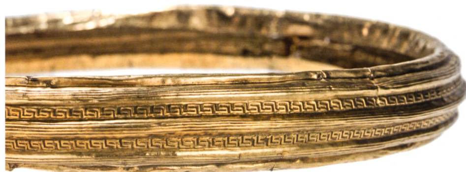
Fig. 1: Torque en or de la tombe de Payerne (Suisse, Vaud), VI e siècle av. J.-C.

Après plusieurs expositions hors les murs,