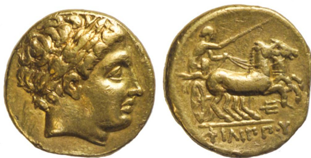
Fig. 2: Statère posthume de Philippe II de Macédoine, 323–317 av. J.-C. (échelle 2:1).

une première exposition permanente portant le nom évocateur de « Collections monétaires » est réalisée en 1997. En 2015, elle est entièrement actualisée et devient « Par ici la monnaie! », un parcours ludique qui mêle Histoire et Économie.