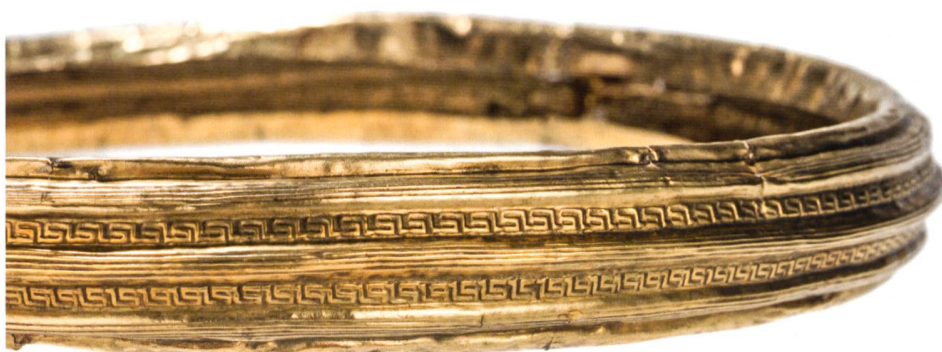
Fig. 1: Torque en or de la tombe de Payerne (Suisse, Vaud), VI e siècle av. J.-C.