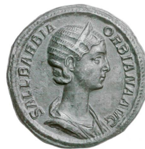
Sallustia Barbia Orbiana, sesterce de bronze