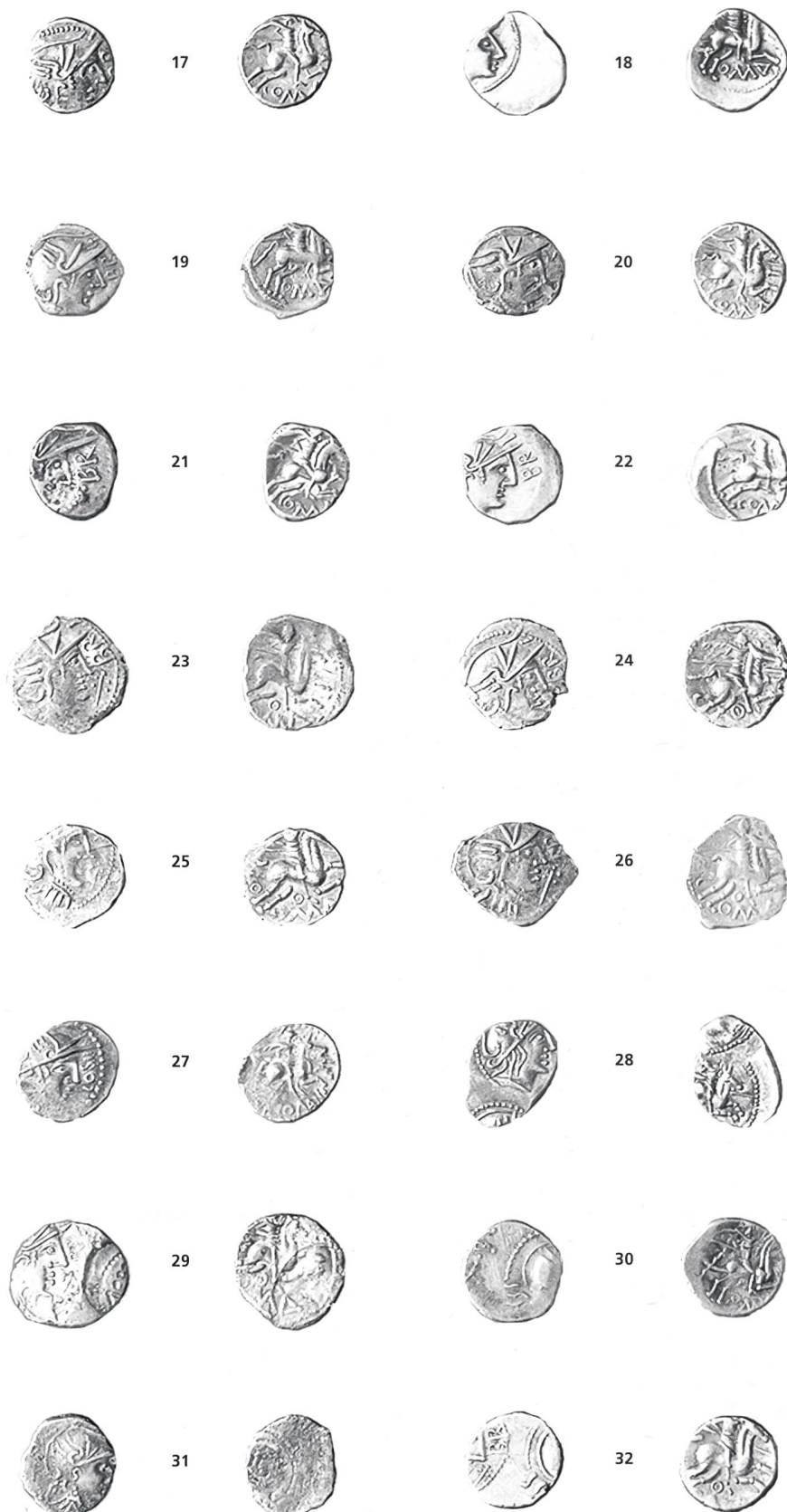
Collection Müller, cat. 17–32.