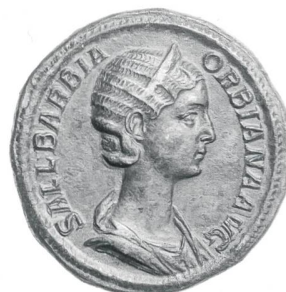
Sallustia Barbia Orbiana, sesterce de bronze