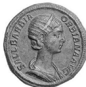
Sallustia Barbina Orbiana, sesterce de bronze